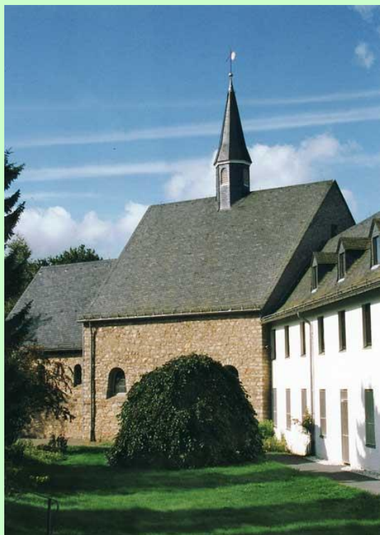
Benediktinerinnen-Abtei Kloster Steinfeld